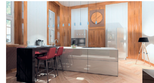
Planungsbeispiele für Wohnung 3, 6 und 7